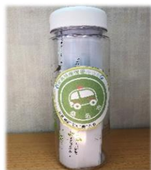
益世版救急医療情報キット